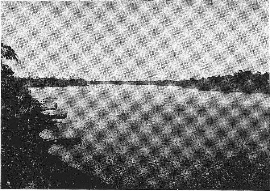
Vista al norte del lago Yarinacocha desde la base del Instituto Lingüístico de Verano.