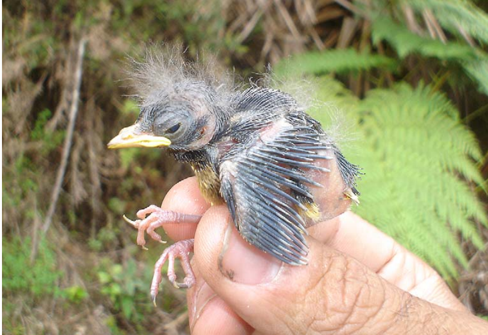
FIG. 4. Pichón de Myioborus flavivertex fotografiado el 9 de Julio de 2007 en la Cuchilla de San Lorenzo, Sierra Nevada de Santa Marta.

días después de que se terminó de construir; al examinarlo, sólo encontramos fragmentos de cascarones de un huevo, igualmente blanco con pequeñas manchas de color café.