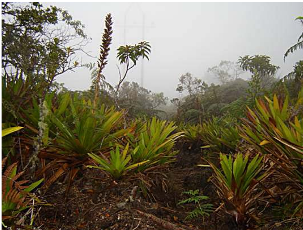
FIG. 1. Hábitat del sector de Las Bromelias, Cuchilla de San Lorenzo, Sierra Nevada de Santa Marta (2155 m de elevación) donde fue encontrado un nido de Myioborus flavivertex el 9 de Junio de 2007.

zontal, dentro de una pequeña depresión a 1,25 m del suelo. El nido tenía forma de taza con un techo; podría ser también descrito como un domo de forma oblonga, o, siguiendo la terminología de Simon & Pacheco (2005), como una estructura cerrada, globular y soportada por la base; esta descripción general se aplica también a los demás nidos descritos a continuación. Este nido estaba construido principalmente con hojas de pino ( Pinus patula ) y otras fibras vegetales secas, y estaba rodeado por vegetación densa que le brindaba camuflaje, incluyendo raíces y helechos secos, bromelias terrestres y musgos (Fig. 1). Fue imposible realizar medidas y seguimiento al nido debido a que un deslizamiento de tierra lo sepultó un día después de ser encontrado.