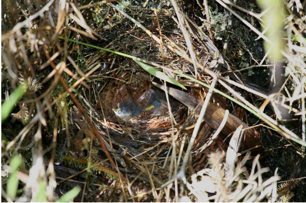
FIG. 2. Nido de Myioborus flavivertex encontrado el 16 de Julio de 2007 en la Cuchilla de San Lorenzo, Sierra Nevada de Santa Marta, a 2080 m de elevación.

color anaranjado, con muchas escamas de helechos arborescentes de color café rojizo (Fig. 2).